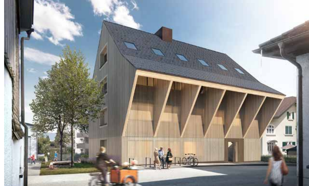
Ausladendes Vordach zur Wagnerstraße

Ein Haus mit ausladendem Vordach zur Straße, ein Haus, gebaut aus guten Materialien, ein Haus mit Liebe zum Detail.