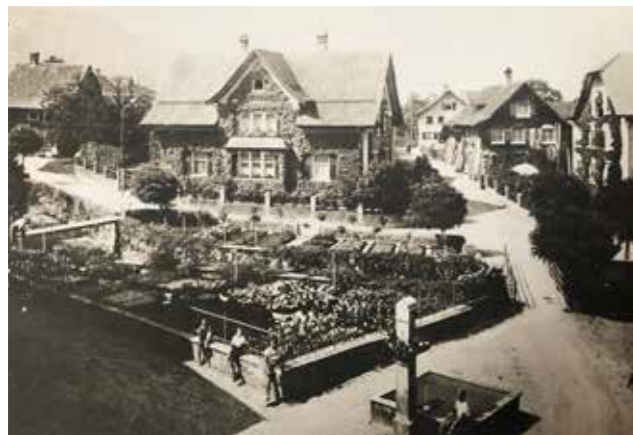
Blick von der Burgstraße über den Emsbach zur Wagnerstraße

Zu deren Belebung werden öffentliche Räume aufgewertet, der Verkehr beruhigt und das räumliche und malerische Potential zur Entfaltung gebracht. Bachläufe, Gassen und Plätze werden gerade Schritt für Schritt geordnet und zu einem sympathischen Wohnviertel direkt an der Stadtmitte entwickelt. Das alte Rathaus am Emsbach, Stoffels